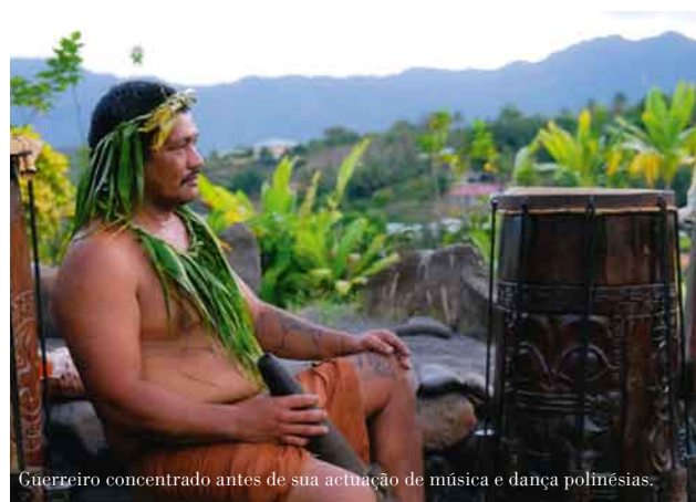
Guerreiro concentrado antes de sua actuação de música e dança polinésias.

Os aborígenes conhecem o arquipélago pelo nome de Te Henua'enana “Terra de homens”. Os seus habitantes são descendentes de guerreiros e bravos navegantes, o que se constata ao ver os seus enormes corpos possuidores de uma agilidade invejável. Isto deve-se ao facto de que para povoar estas longínquas ilhas, a única forma de as atingir, era remando pelas águas do Pacífico e somente os mais fortes o conseguiam, por isso os habitantes de Marquesas sempre foram uns temíveis adversários em qualquer batalha. Hoje, ainda se pode desfrutar de algumas danças de guerreiros, nas quais nos mostram como intimidavam os