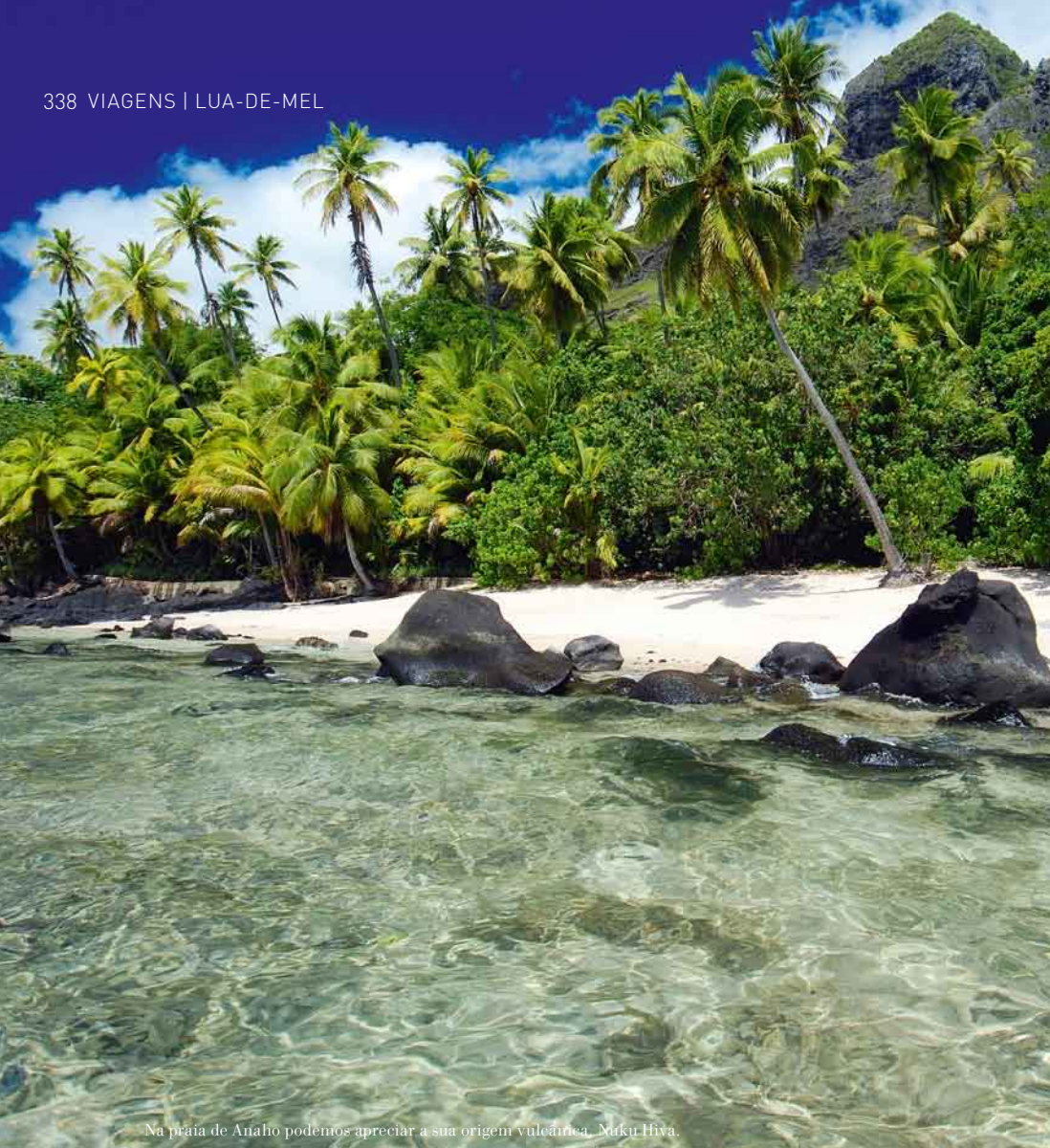
Na praia de Anaho podemos apreciar a sua origem vulcânica. Nuku Hiva.