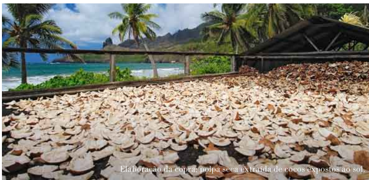
Elaboração da côpra: polpa seca extraída de cocos expostos ao sol.