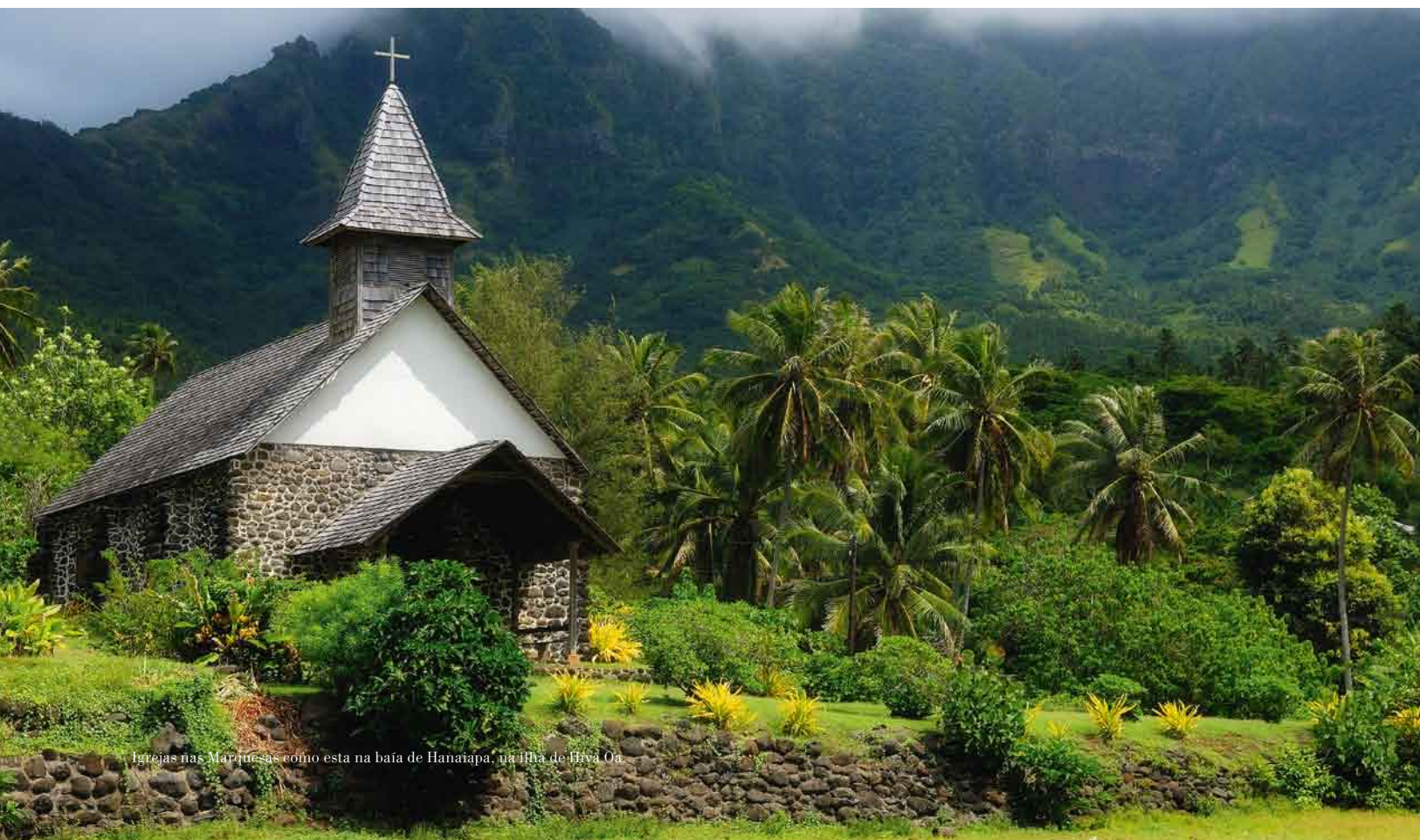
Igrejas nas Marquesas como esta na baía de Hanaiapa, na Ilha de Hiva Oa.