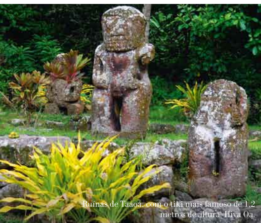
Ruínas de Taaoa, com o tiki mais famoso de 1,2 metros de altura, Hiva Oa.

Mas a verdadeira surpresa final aguarda-nos no barco, estrategicamente ancorado em frente da baía das Virgens, que nos serve de plataforma para contemplar o mais espectacular entardecer que jamais tínhamos se verá com a baía tingindo-se paulatinamente de magenta, vermelho e púrpura e o sol ocultando-se nas nossas costas no horizonte, tudo isto acompanhado pela melodia do ukelele e pelas canções com que nos brinda a tripulação para fazer da nossa viagem às Marquesas algo realmente inesquecível. ☞