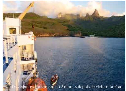
Os viajantes embarcam no Aranui 3 depois de visitar Ua Pou.