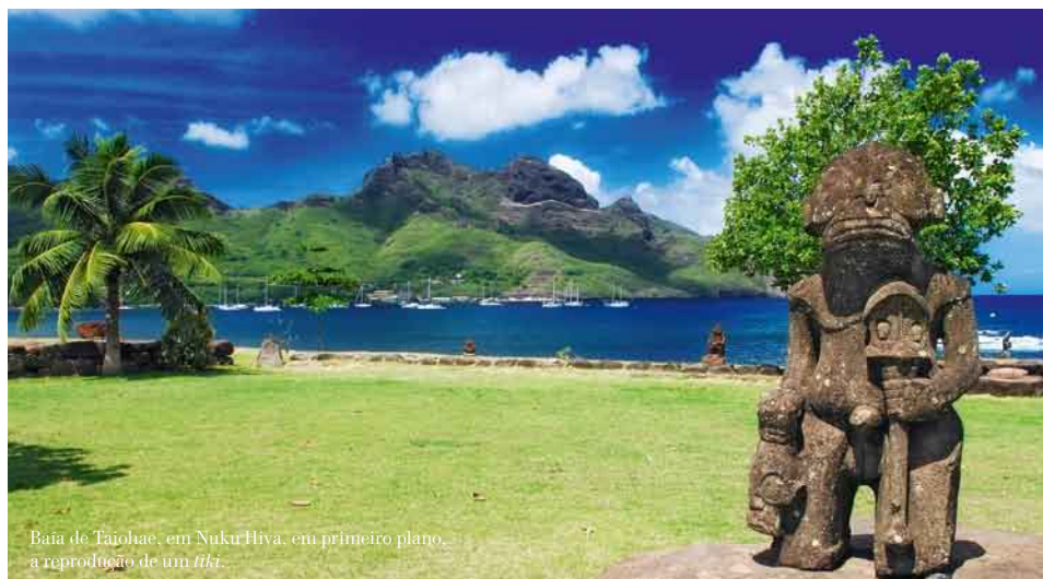
Baía de Taiohae, em Nuku Hiva, em primeiro plano, a reprodução de um tiki .