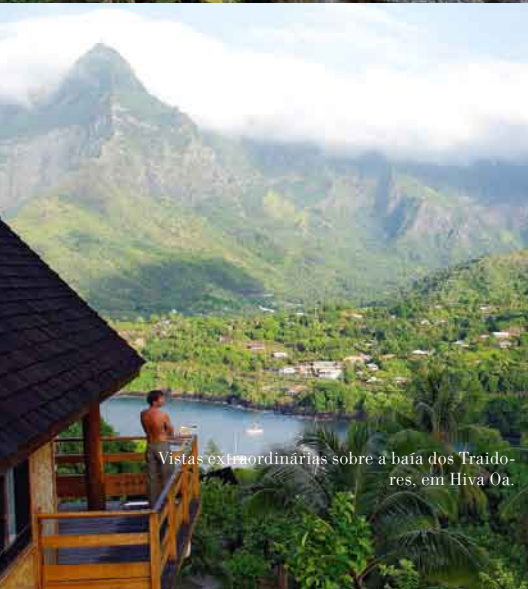
Vistas extraordinárias sobre a baía dos Traidores, em Hiva Oa.