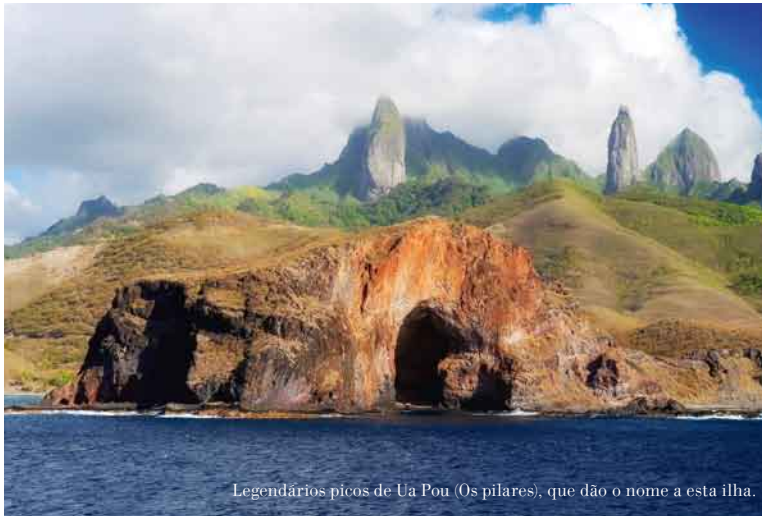
Legendários picos de Ua Pou (Os pilares), que dão o nome a esta ilha.