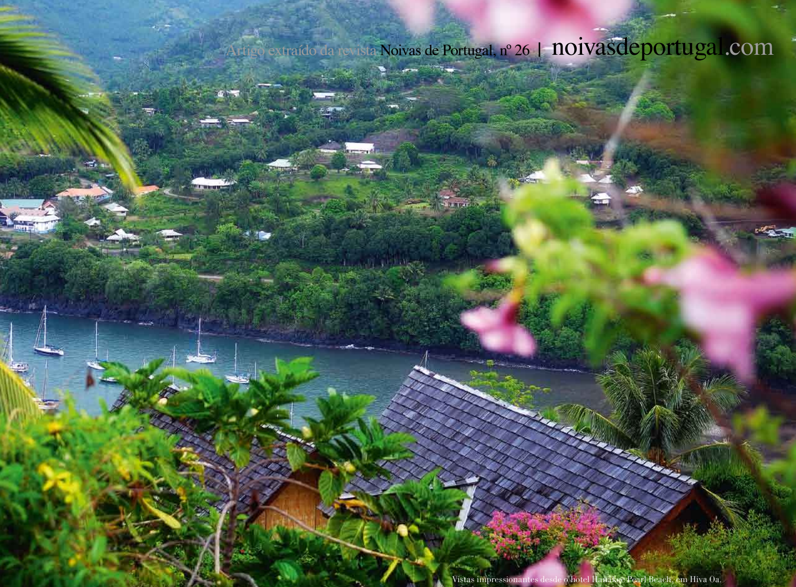
Vistas impressionantes desde o hotel Hanakoo Pearl Beach, em Hiva Oa.