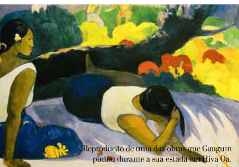
Reprodução de uma das obras que Gauguin pintou durante a sua estada em Hiva Oa.

Marquesas têm um povo amável e encantador que fará qualquer coisa para agradar aos seus convidados e visitantes.