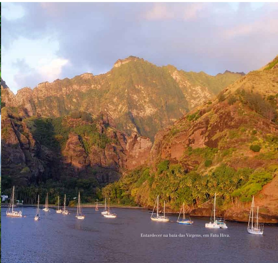
Entardecer na baía das Virgens, em Fatu Hiva.