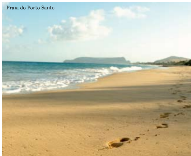
Praia do Porto Santo