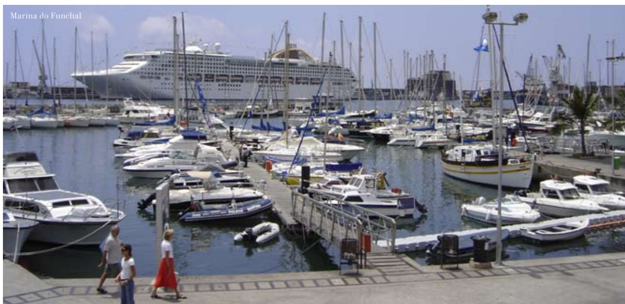
Marina do Funchal