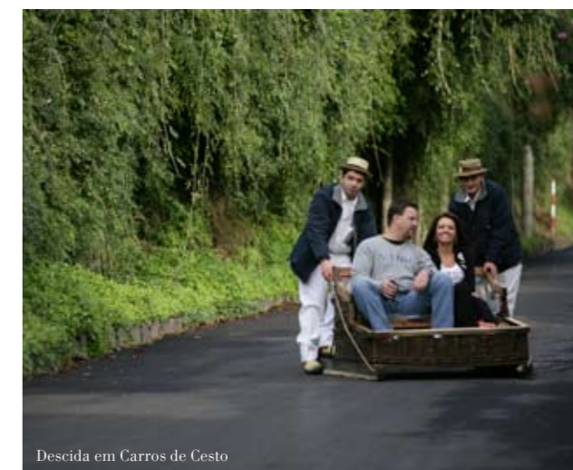
Descida em Carros de Cesto