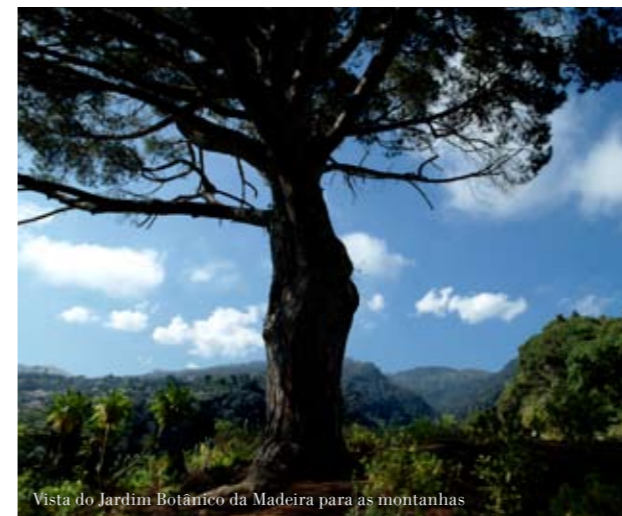
Vista do Jardim Botânico da Madeira para as montanhas