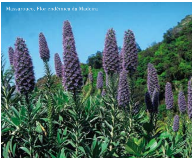
Massarouco, Flor endêmica da Madeira