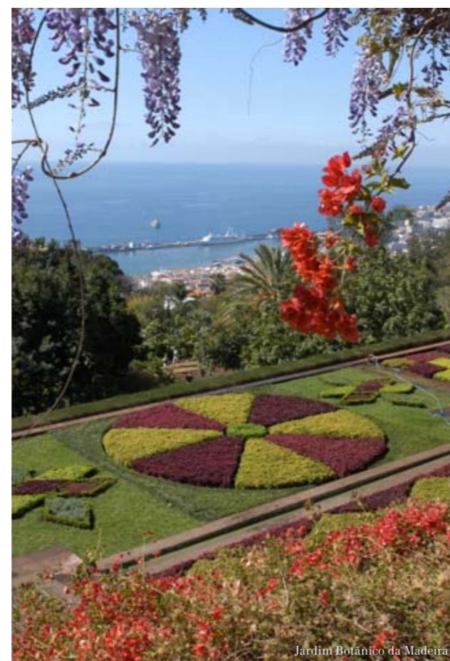
Jardim Botânico da Madeira