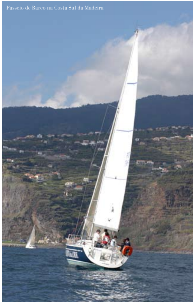
Passeio de Barco na Costa Sul da Madeira