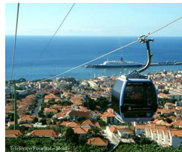
Teleférico Funchal - Monte