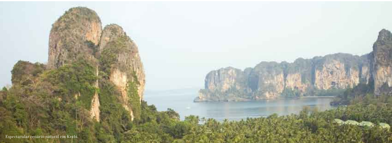
Espectacular cenário natural em Krabi.