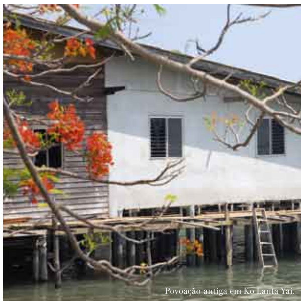
Povoação antiga em Ko Lanta Yai.