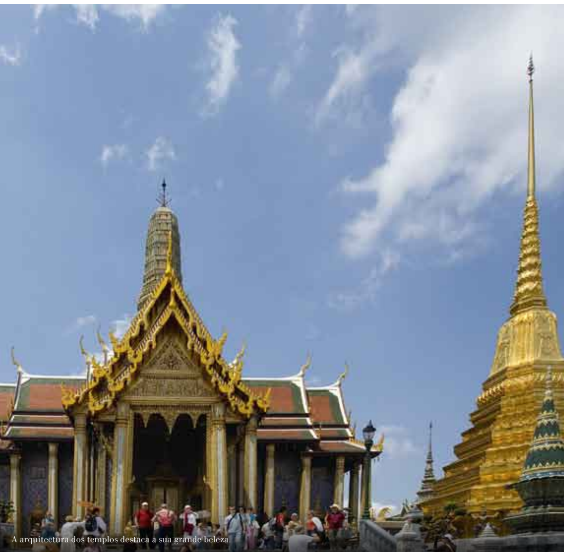
A arquitectura dos templos destaca a sua grande beleza.