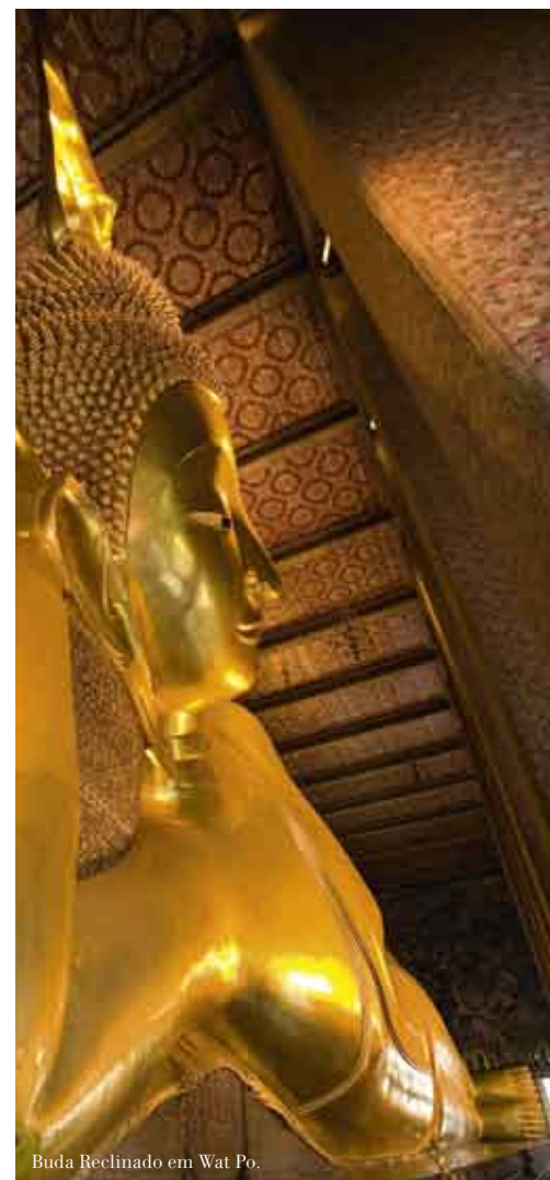
Buda Reclinado em Wat Po.