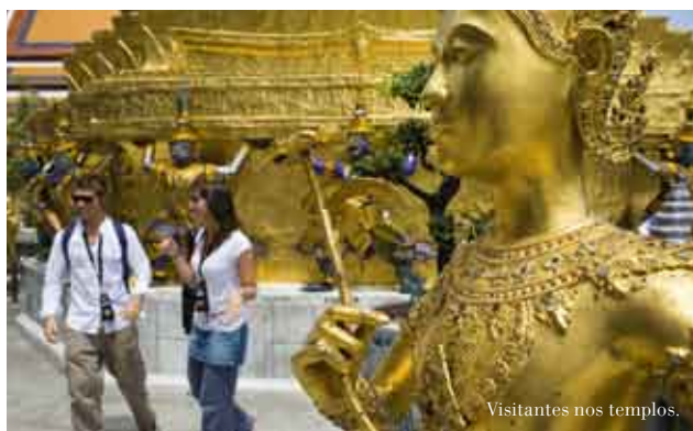
Visitantes nos templos.