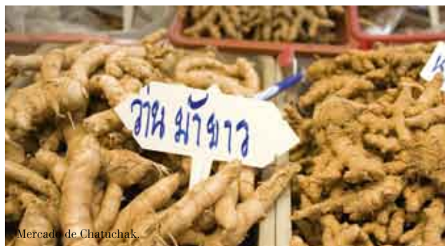
Mercado de Chatuchak.