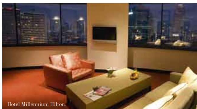
Hotel Millennium Hilton.