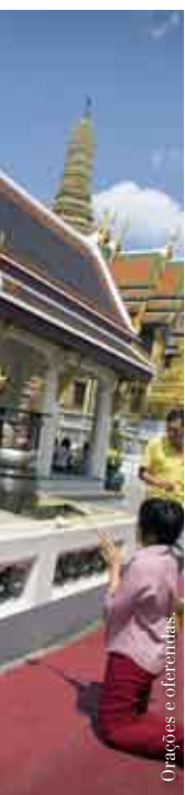
Orações e oferendas.