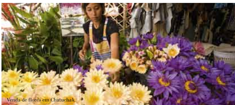
Venda de flores em Chatuchak.