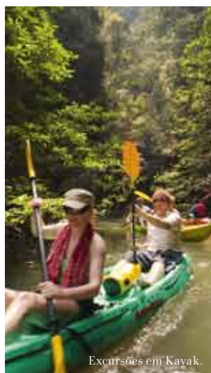
Excursões em Kayak.