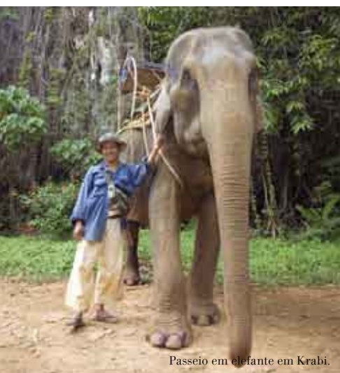
Passeio em elefante em Krabi.