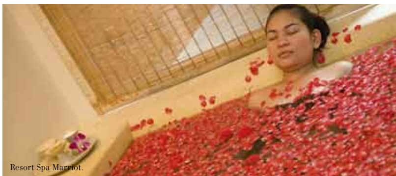
Resort Spa Marriott.