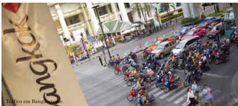
Tráfico em Bangueoque.

Diversas companhias aéreas oferecem voos com destino à Tailândia e existem programas específicos de diversos operadores turísticos.