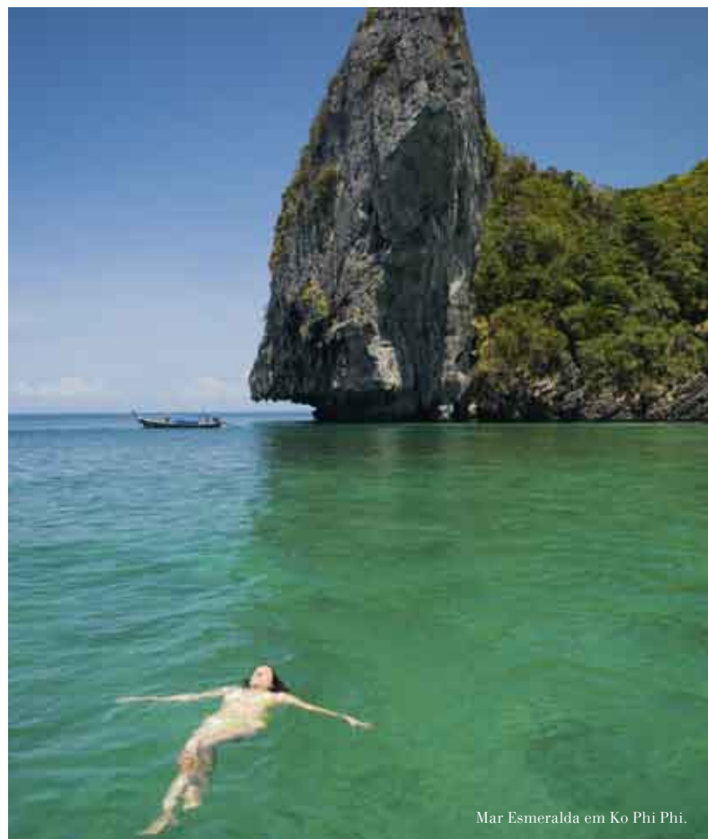
Mar Esmeralda em Ko Phi Phi.