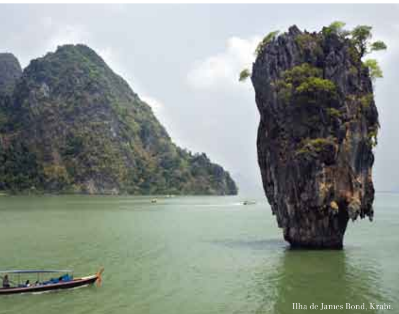
Ilha de James Bond, Krabi.