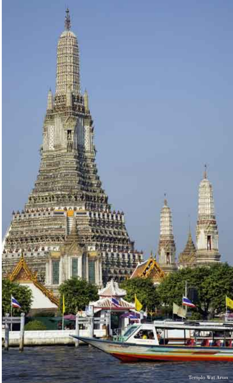
Templo Wat Arun.